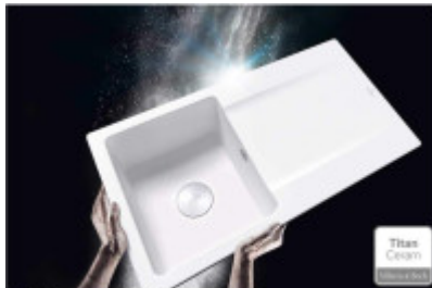
Titan Ceram - Der Werkstoff der Zukunft! Die Eigenschaften hochwertiger Keramik mit außergewöhnlicher Festigkeit vereint. Titan Ceram ermöglicht kreislaufende fliegende Formen.