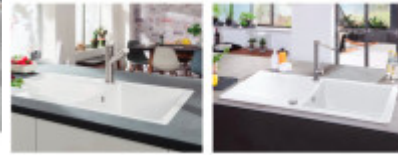
Abbildung: Siluet 50 in Weiß (links) Dieses Schüsselbild ist beispielhaft. Alle Illustrationen stellen nur die Seite der Artikelbeschreibung.