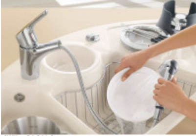
Abbildung: Zele Eco in Green Dieses Symbol ist gesetzlich. Alle Informationen entnehmen Sie bitte der Anbauanleitung.