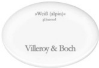
Die weiße Glasplatte ohne Einschlüsse - glänzend Die Abdeckung ist stark vergriffen! (Originalgröße: 93 mm x 41 mm)