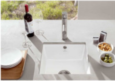
Abbildung: Subway 50 50 in Weiß (alpin) Dieses Symbol ist eingetragenes. Ihre Informationen entnehmen Sie bitte der Artikelbeschreibung.